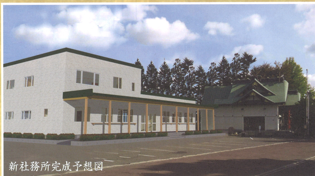
新社務所完成予想図